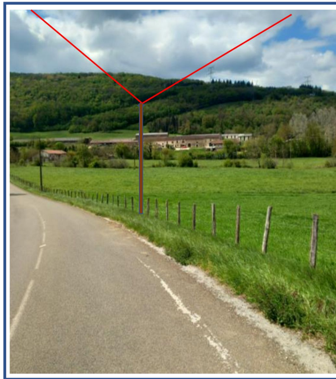
Commentaires du propriétaire