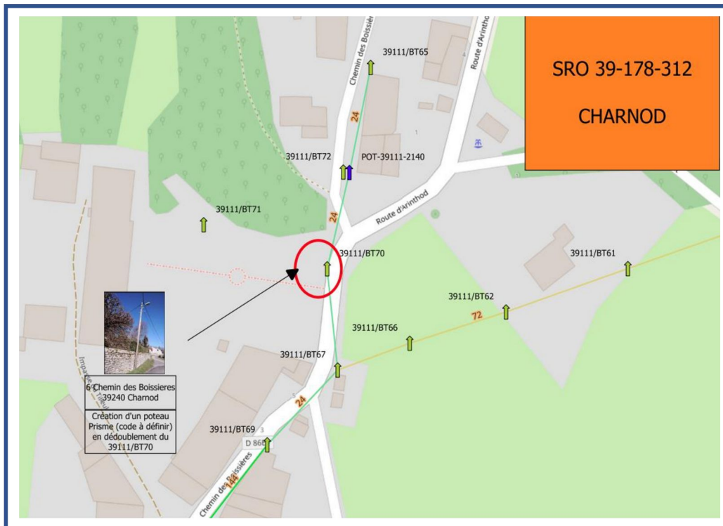
Vue en plan