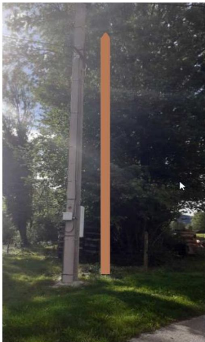
rue de salins 7326