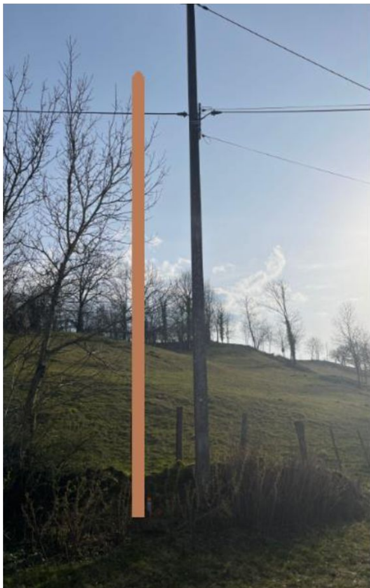
8 rue de salins 7363