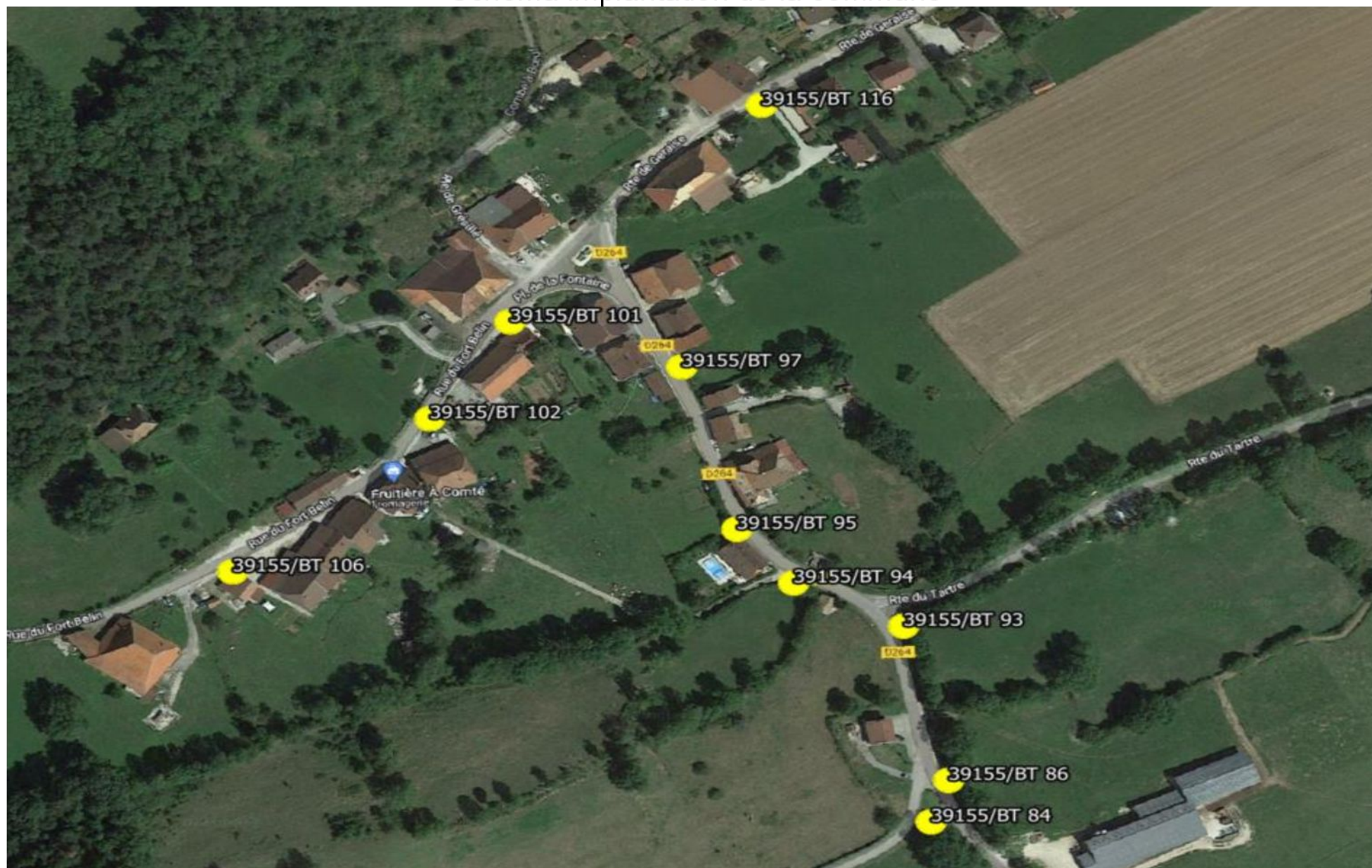
Schéma implantation de la commune