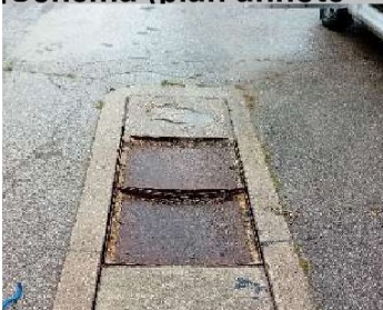
Schéma (plan annoté + situation Google si possible + photos)

Tampons de chambre en mauvais état, soumis à des fortes charges, la chambre étant située sur une aire de parking/repos Poids lourds